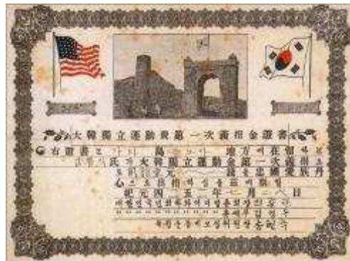
독립의연금 영수증

국민회(國民會)는 한인사회에서 중추적인 역할을 하며 1933년 1월 하와이와 북미에 있던 각각의 국민회가 통합되어 대한인국민회로 개칭되었고 하와이에는 하와이 지방총회가 설립되었다. 대한인국민회는 독립운동을 지원하기 위해 자금을 모으고