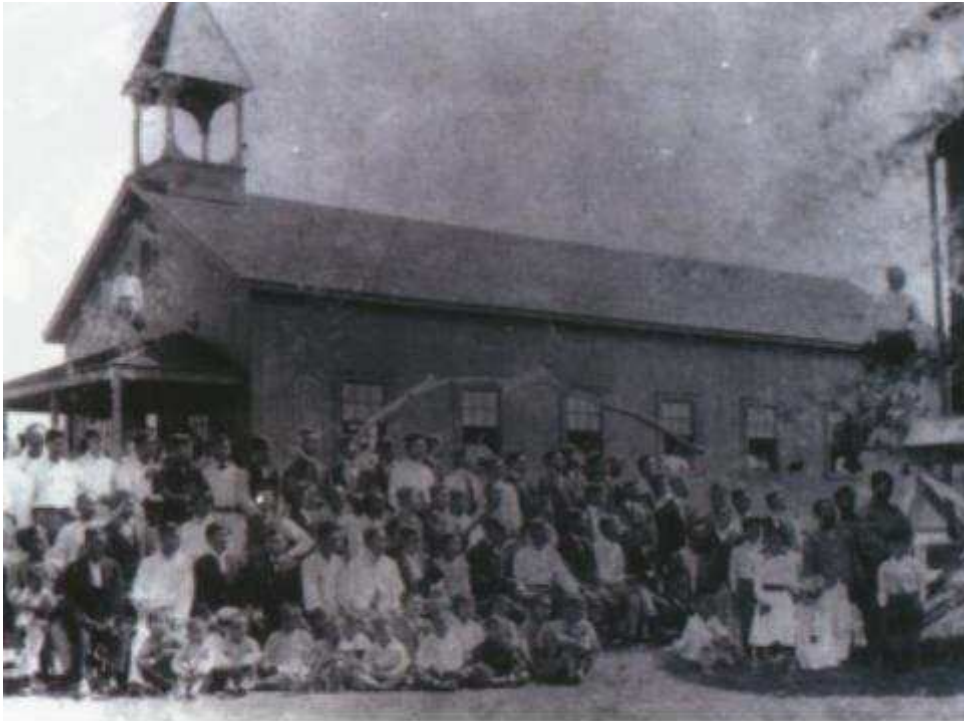
하와이에 세워진 최초의 예와 한인감리교회

1905년 8월부터 22일간 하와이 농장을 방문했던 노블(William A. Noble) 선교사는 하와이에 있는 한인 노동자들이 이전에 한국에서 하던 것처럼 우상숭배를 전혀 하지 않는다고 보고하였다. 또한 1906년 7월부터 두 달 동안 농장을 방문한 존스 목사도 그들이 근면하고 정직하며, 기독교 신앙으로 화합과 화목을 배우고 있다고 기록하였다.