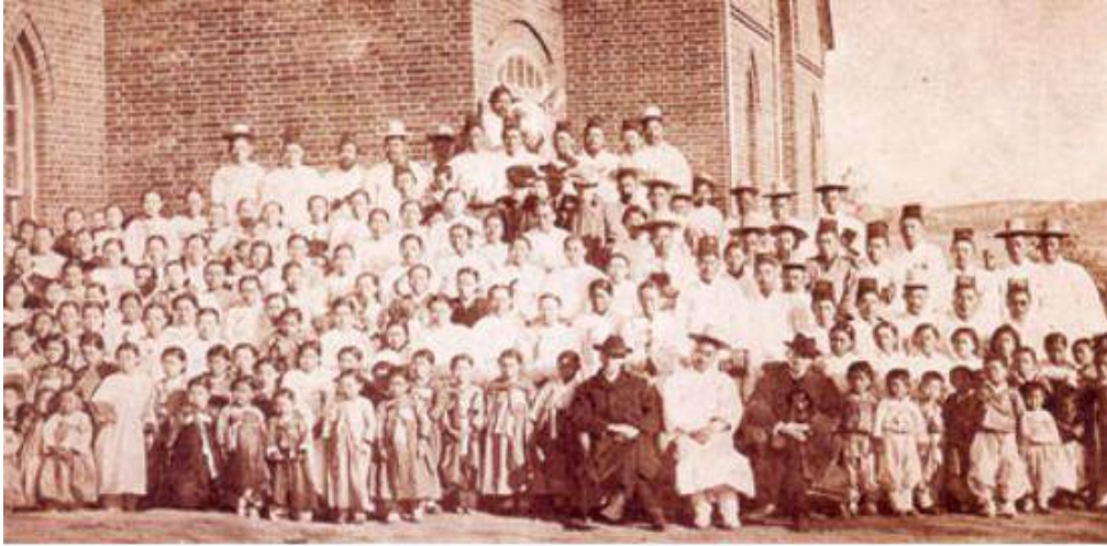
용동감리교회(현 내리교회) 교인들

역관 남자2명, 여자 21명, 어린아이들 24명) 미국의 상선 겐릭호(S.S.Gaelic)호를 타고 하와이 호놀룰루로 출발하였다.