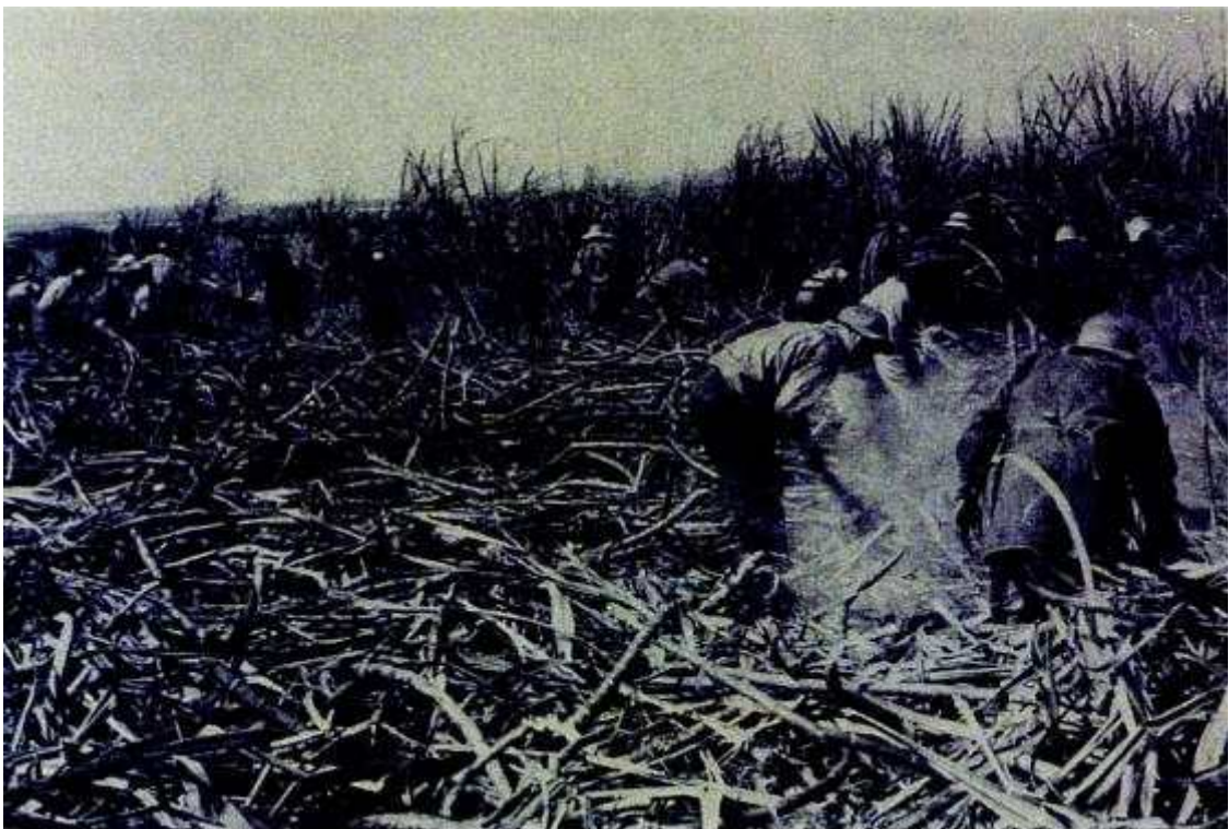
사탕수수밭에서 노동모습

하와이에 도착한 이민자들은 하와이 호놀룰루의 와이알루아 농장을 비롯하여 4개의 섬에 있는 32개 농장에 배치되었다. 사탕수수 농장에서 이들은 오전 6시부터 하루 10시간씩 고된 노동을 해야만 했는데, 이들이 받는 월급은 고작 16달러였다. 어느 농장에서는 감독관이 일하지 않는 노동자들에게는 채찍을 때리기도 하였다.