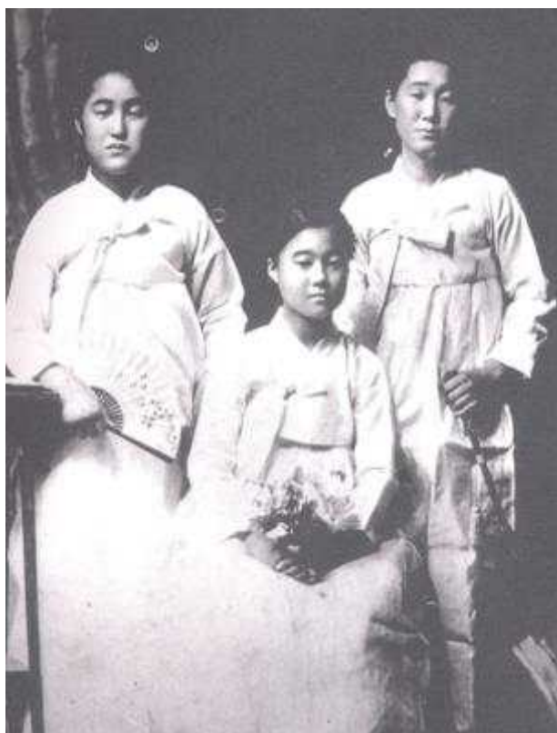
마을에서 함께 떠난 사진신부

사진신부는 미국에 있던 남자가 본국에 있는 처녀에게 사진을 보내 선을 보인 후 그 사진을 보고 시집가기를 허락하는 처녀를 데려다가 혼인하던 풍속을 표현하는 말이다.