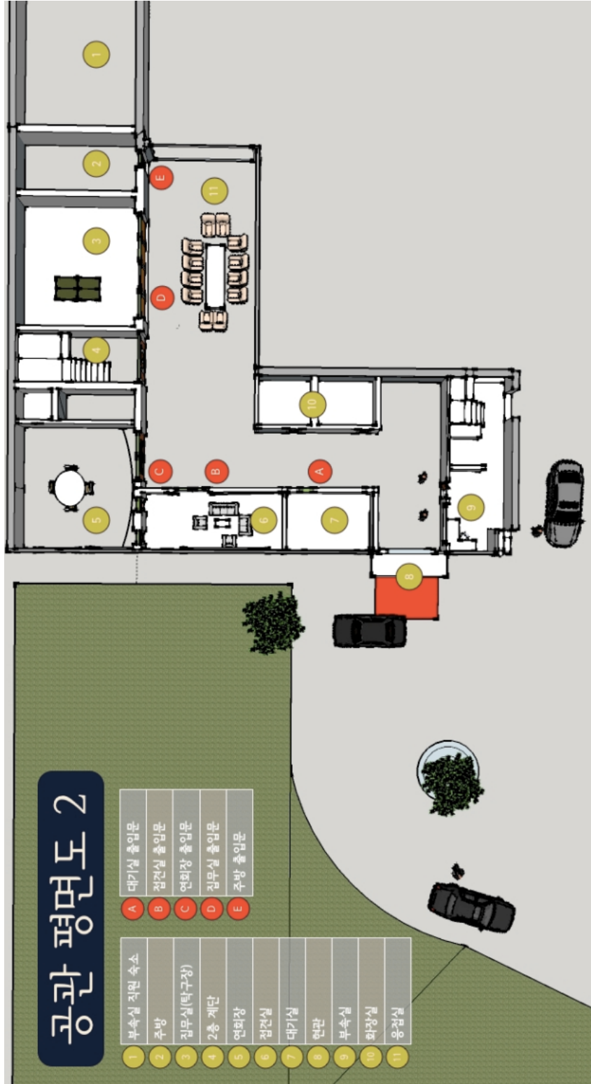
[별지 7] 현장검증조서 첨부 공관평면도 2